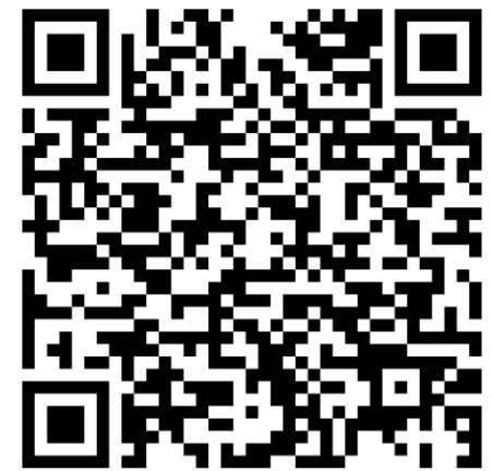
110 年台南市賽雲端報到文件袋